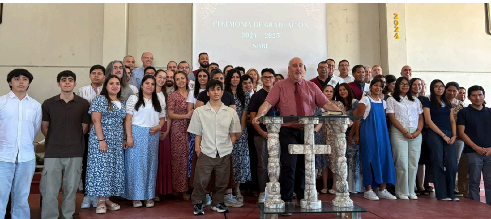
Ceremonia de clausura del pasado mes de julio